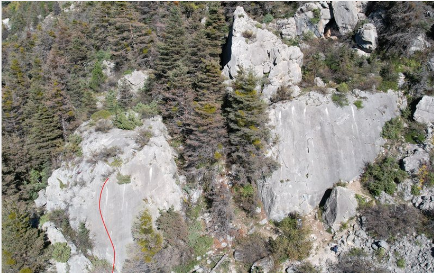
(Nicolas Bianchi - Parc national des Ecrins)