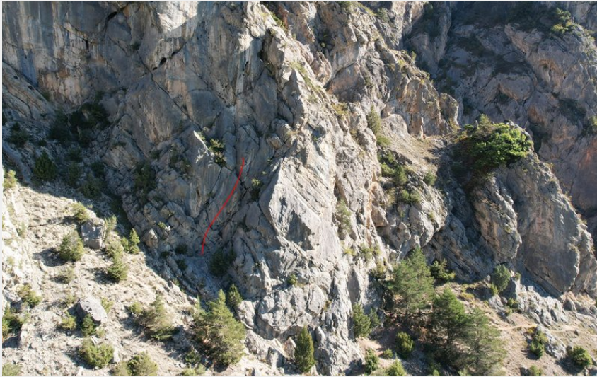
(Nicolas Bianchi - Parc national des Ecrins)