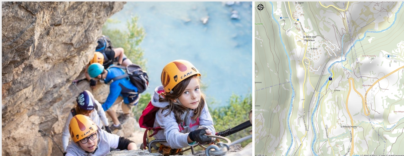
Via Ferrata Gorges de la Durance Verte (Thibaut Blais)

Accessible à partir de 6 ans, cette via ferrata facile grimpe en rive gauche de la Durance. Le départ est le passage le plus sportif, dans un mur raide, mais il peut être évité en suivant la Durance puis en prenant une échelle. Après ce passage, une petite passerelle amène à un couloir, où se situe le premier échappatoire. Après cette passerelle, une courte traversée mène au deuxième échappatoire. Après cette dernière intersection, la via continue de traverser la gorge jusqu'à la sortie de la via.