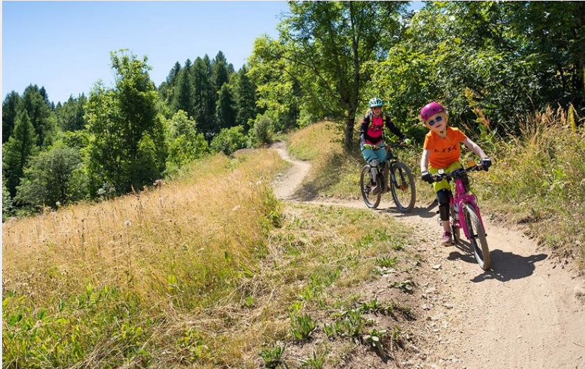
(Rogier van Rijn)

Aire d'Adhésion du Parc National des Écrins