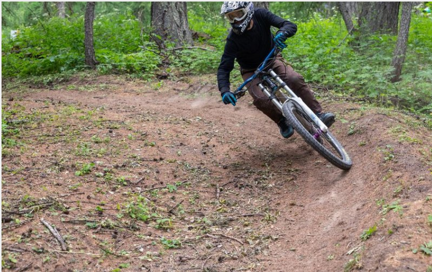
(Rogier van Rijn)

Aire d'Adhésion du Parc National des Écrins