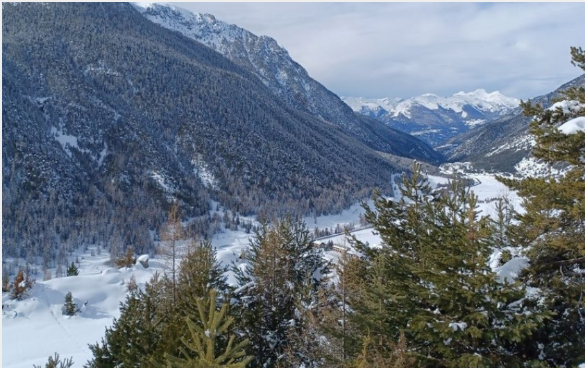
Vue depuis la piste des Balcons