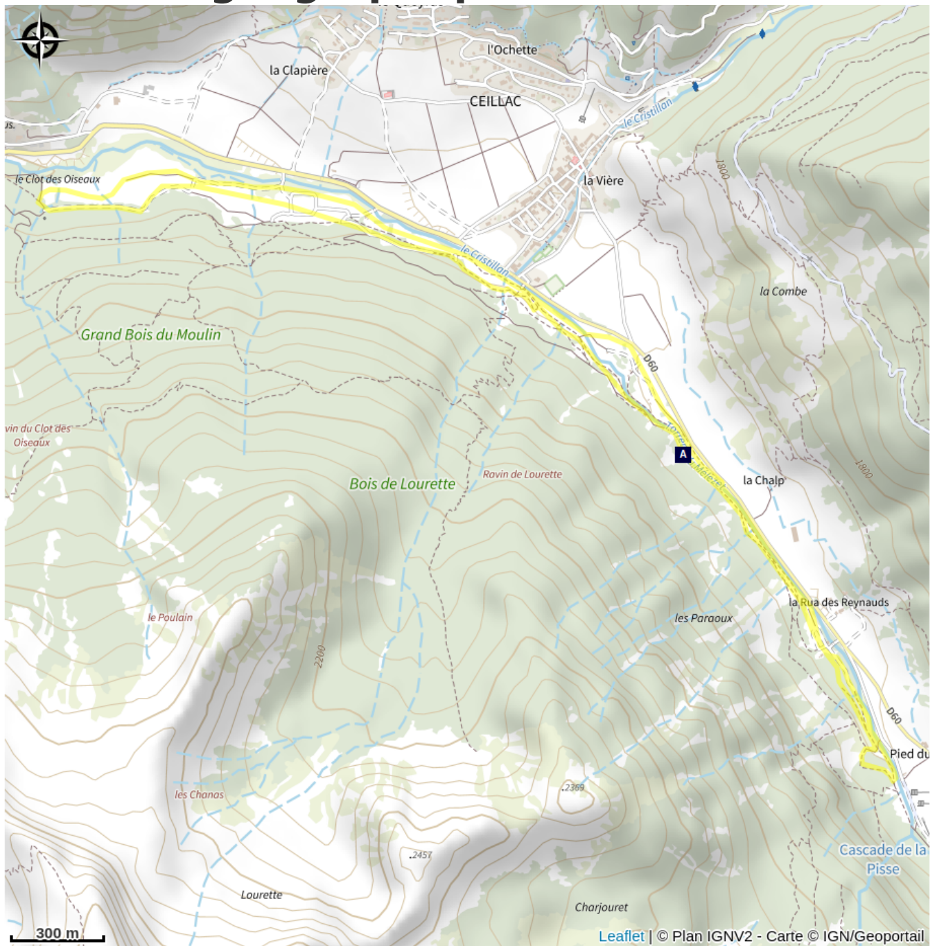
Falaises de cargneules (A)