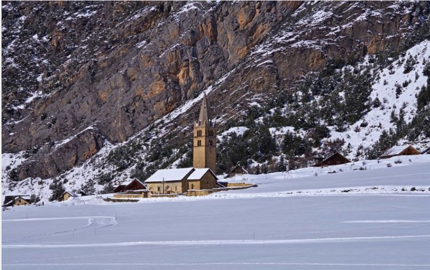
Devant la falaise de la Viste et l'église Sainte-Cécile (Norman Lancelot)