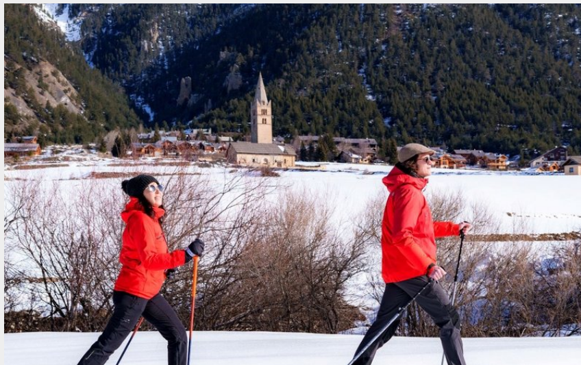
Vue sur l'Eglise Sainte-Cécile