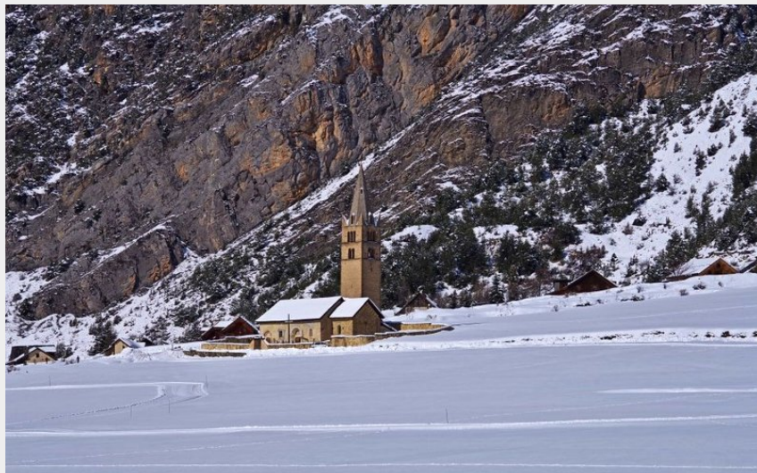
Devant la falaise de la Viste et l'église Sainte-Cécile (Norman Lancelot)