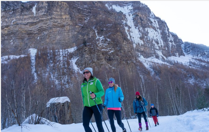
La Plaine de Freissinières (Rogier van Rijn)