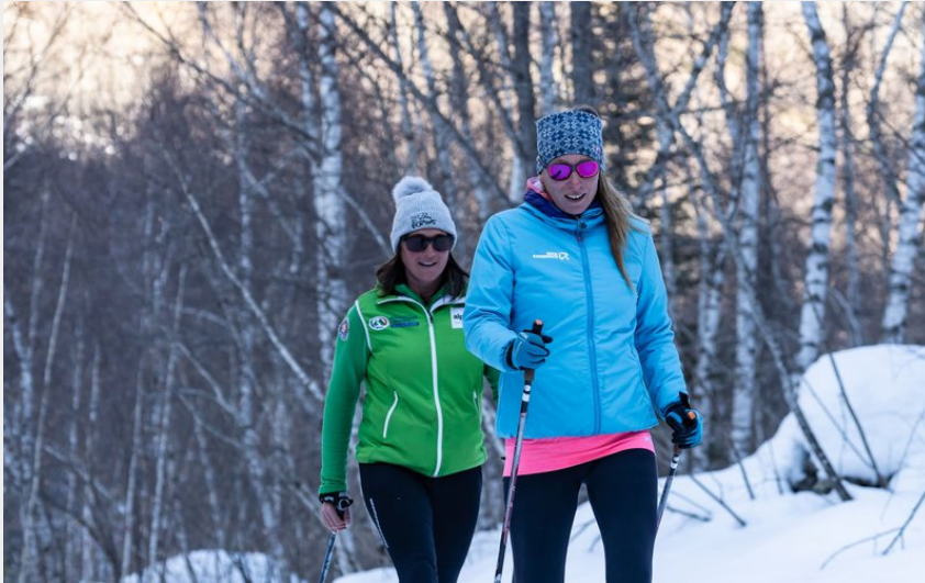
Randonnée aux Allouvières (Rogier van Rijn)