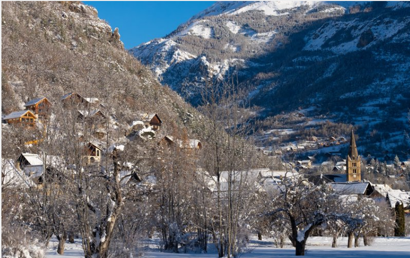
Vallouise (Rogier van Rijn)