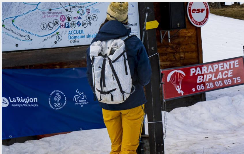
Carte et balisage (Marc Grivaux)