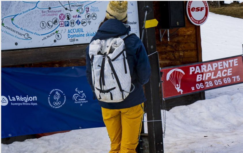
Carte et balisage (Marc Grivaux)