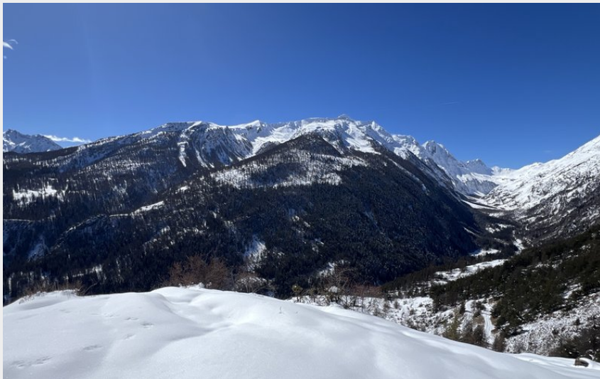
Belvédère sur la vallée du Fournel (Pierre Nossereau)