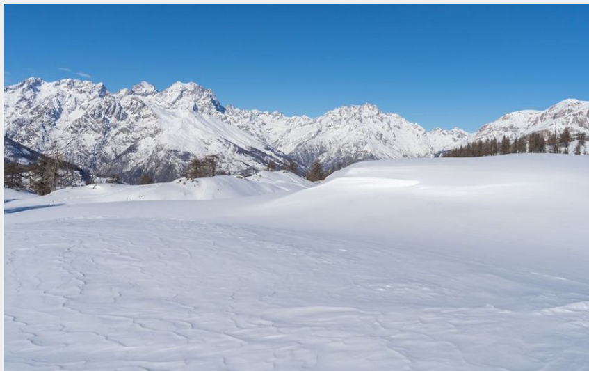
Belvédère depuis le sommet des Têtes (Rogier van Rijn)