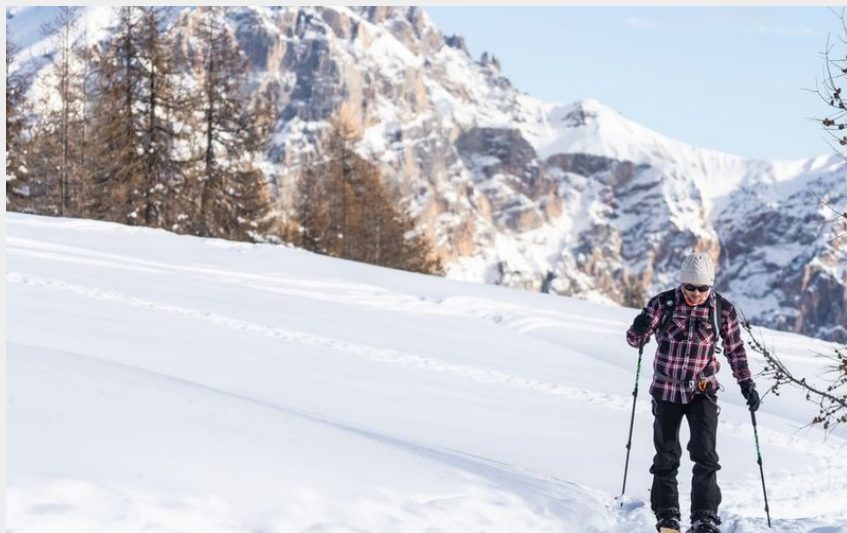
Massif de Montbrison en arrière plan (Rogier van Rijn)