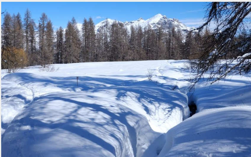
Clairière sous le lac des Hermes (Pierre Nossereau)